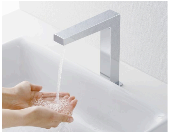
コンテンポラリタイプ(角)

TLP01S01J、 TLE35SS1A、 TLE35SM1A、 TEL20DSA、 TEL24DPRA除く